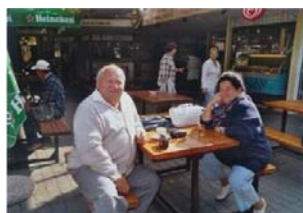
2006. október: Badacsonyban