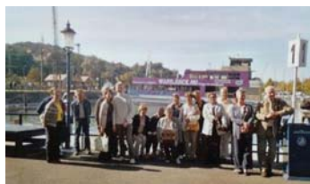
Fonyód, indulásra vároa