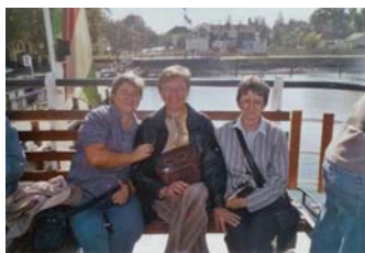
2006. október: Hajón