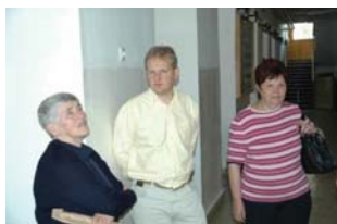
2006. október: Fonyód - tablók nézegetése