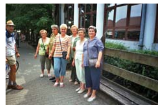
2008. Fonyódi séta