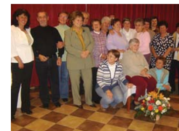
2009. év eseményei